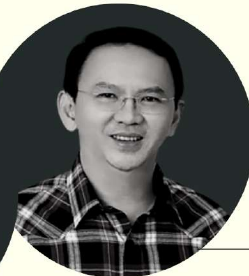
Basuki T. Purnama