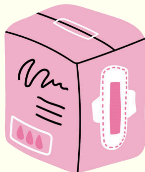
Akses sanitasi yang layak