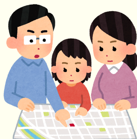
Informasi tempat pengungsian