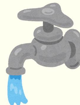
Ketersediaan air bersih