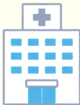
Ketersediaan fasilitas kesehatan